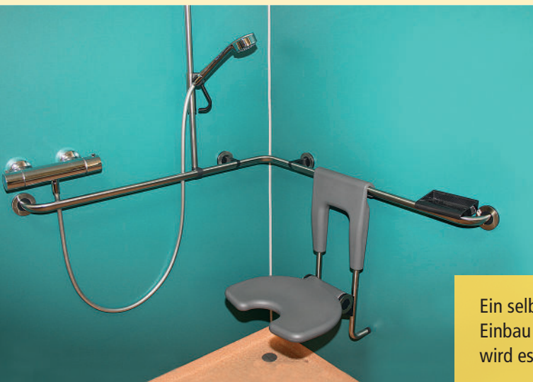
Ein selbständiges Leben führen: Durch den Einbau eines speziellen Sitzes in der Dusche wird es möglich.

Sicherheit und Lebensqualität in vertrauter Umgebung sind für jeden wichtig. Auch wenn ein Umbau der bestehenden Wohnung erforderlich wird, bietet die VdK-Fachstelle Unterstützung an und hilft Ihnen bei der barrierefreien Umgestaltung Ihres Zuhauses.